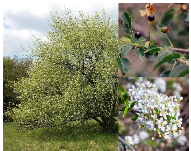
Cerisier de Sainte-Lucie ( Prunus mahaleb ) H6