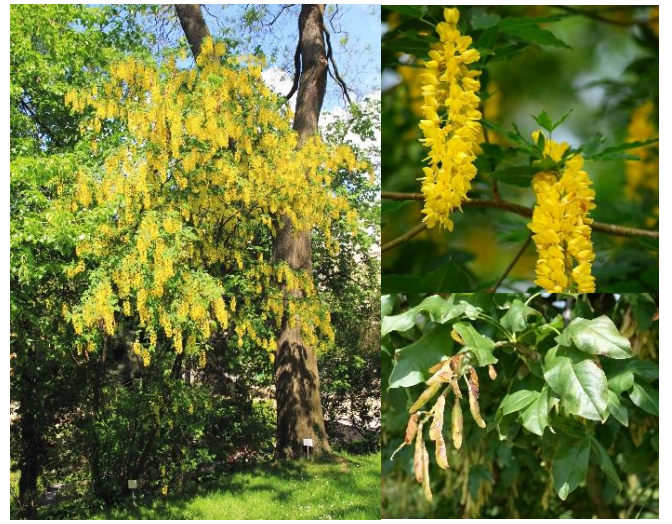
Cytise des Alpes ( Laburnum alpinum ) (H7)