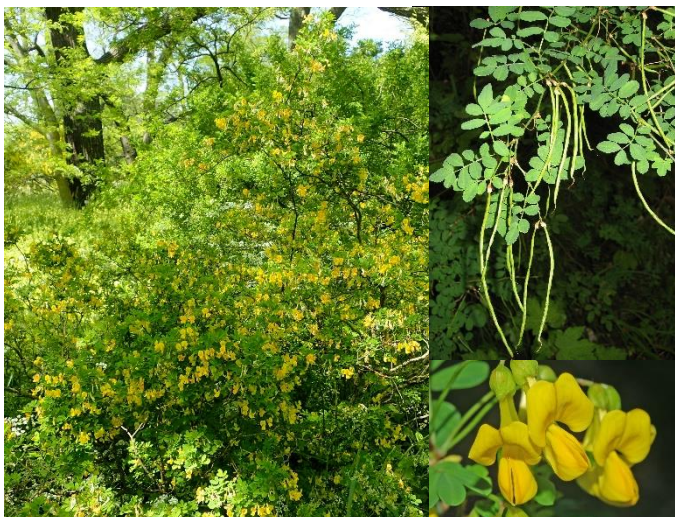
Hippocrévide émerus ( Coronilla emerus ) (H1-2)