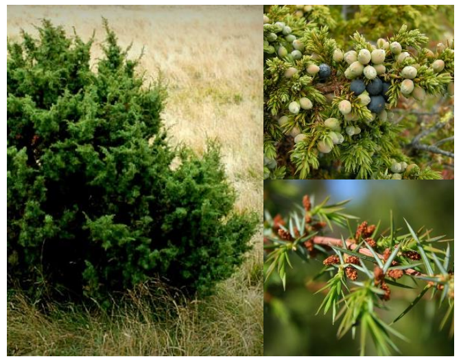
Genevrier commun ( Juniperus communis ) (H3, P)