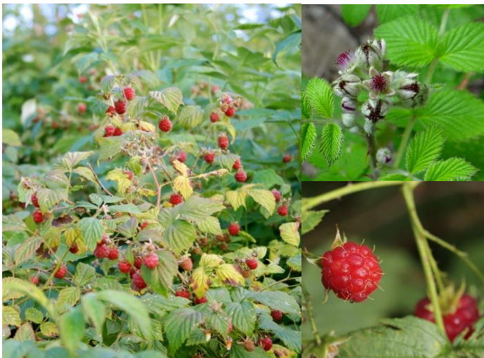
Framboiser ( Rubus idaeus ) (E, H1-2)