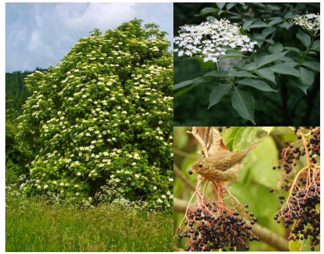
Sureau noir ( Sambucus nigra ) (H7)