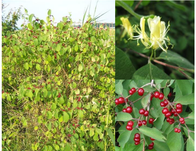
Chèvrefeuille des haies ( Lonicera xylosteum ) (H2)