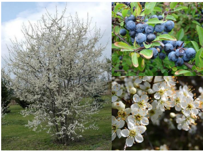
Epine noire ( Prunus spinosa ) (E, H3)