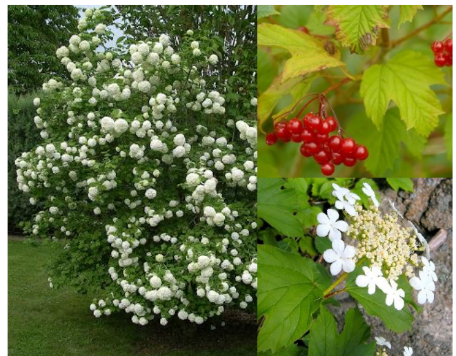
Viorne obier ( Viburnum opulus ) (H3)