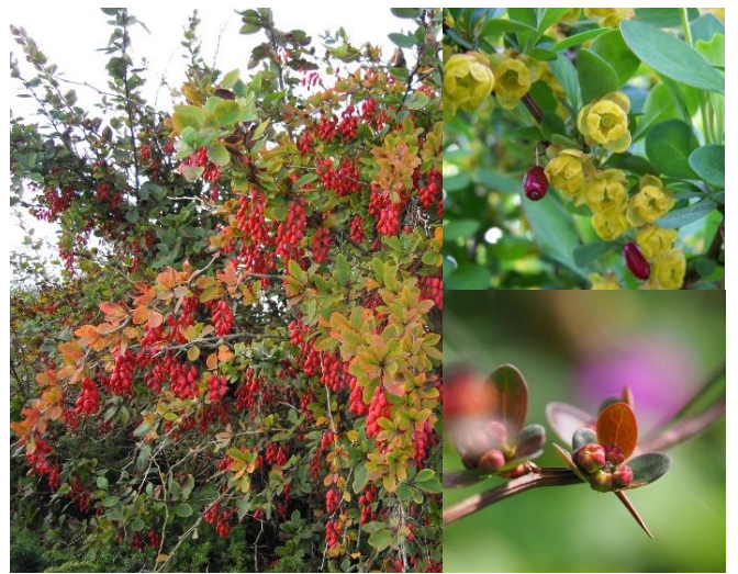
Epine-vinette ( Berberis vulgaris ) (E, H3)