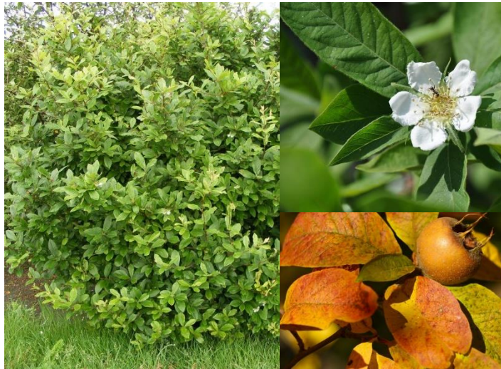
Néflier ( Mespilus germanica ) (H2-4)