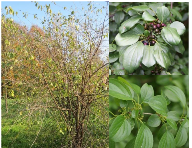
Nerprun purgatif ( Rhamnus cathartica ) (E, H5)