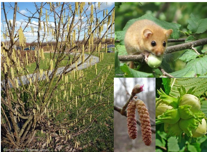
Noisetier ( Corylus avellana ) (H4)