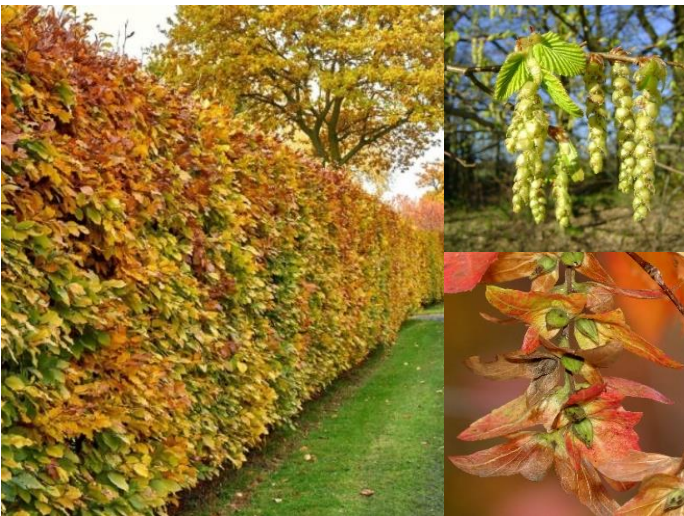
Charme ( Carpinus betulus ) (H20, SP)