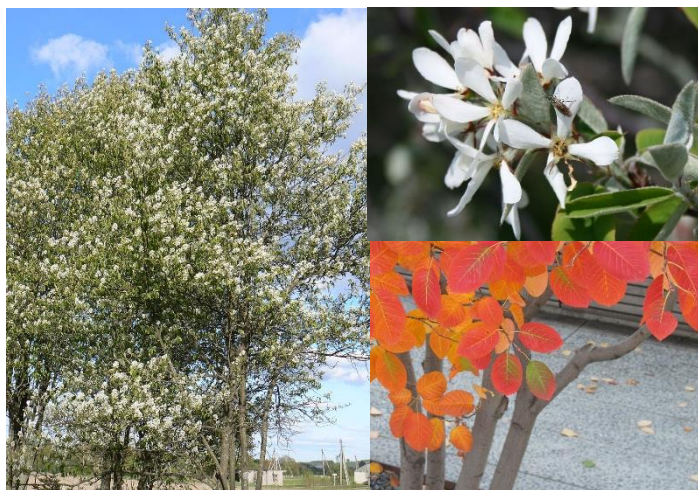
Amélanchier à feuilles ovales ( Amelanchier ovalis ) (H1-3)

Veiller à planter des essences adaptées aux conditions locales de sol, d'exposition et de microclimat