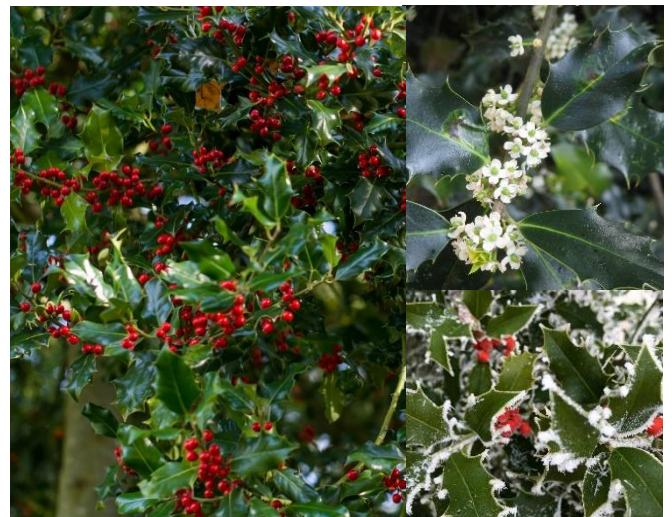
Houx ( Ilex aquifolium ) (H10, P)