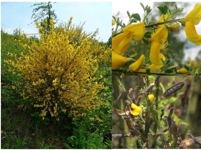
Genêt à balai ( Cytisus scoparius ) (H1-3)