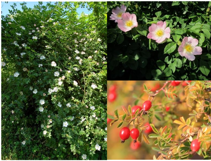
Rosiers sauvages indigènes, dont l'églantier ( Rosa canina , R. arvensis , R. corymbifera , R. rubiginosa , R. spinosissima ) (E, H3)