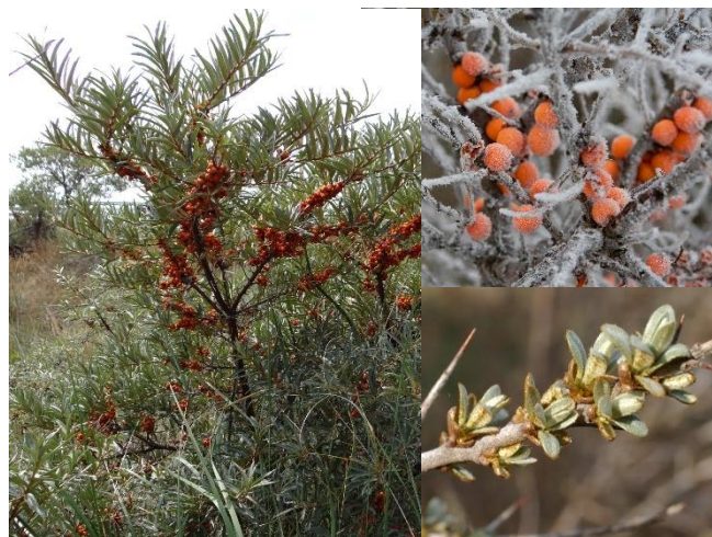
Argousier ( Hippophae rhamnoides ) (E, H5)