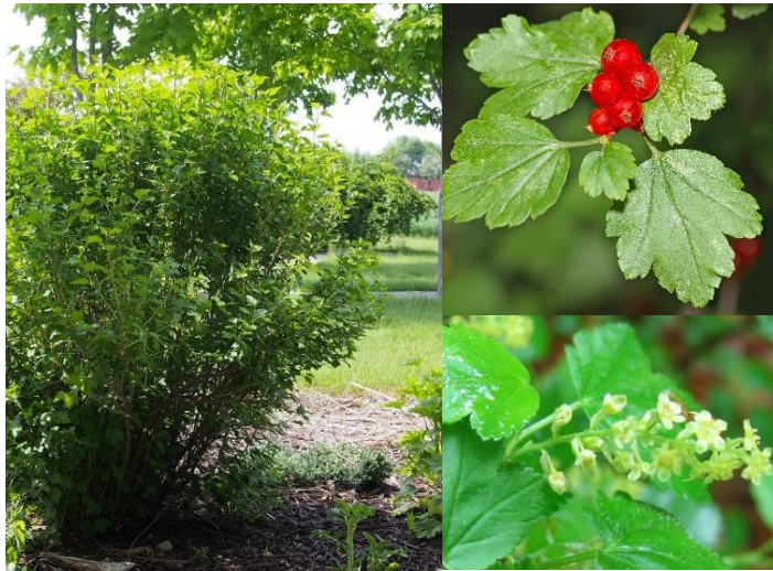
Groseillier des Alpes ( Ribes alpinum ) (H1-2)