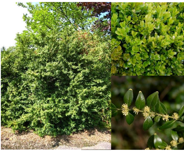
Buis ( Buxus sempervirens ) (H 1-5, P)