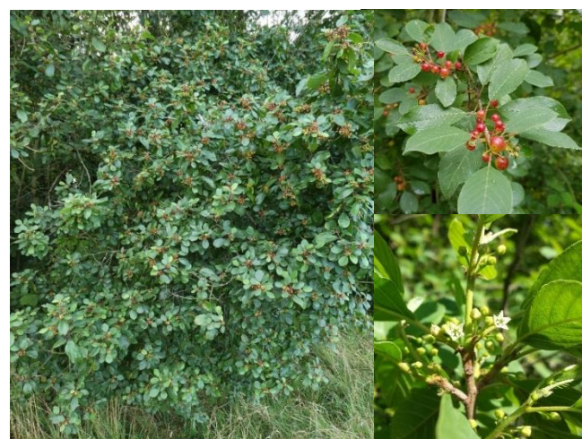
Bourdaine ( Frangula alnus ) (H5)