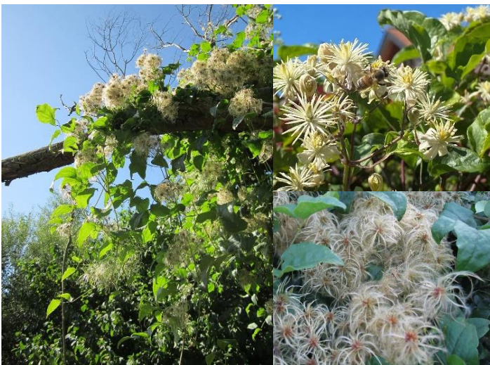
Clématite blanche ( Clematis vitalba ) (H20, L)