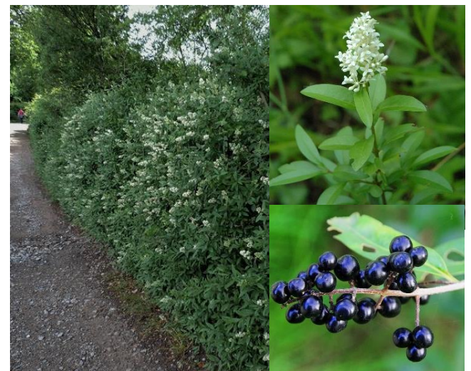
Troène vulgaire ( Ligustrum vulgare ) (H5, P)