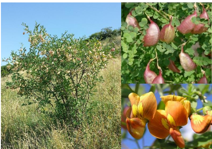
Baguenaudier ( Colutea arborescens ) (H2-4)