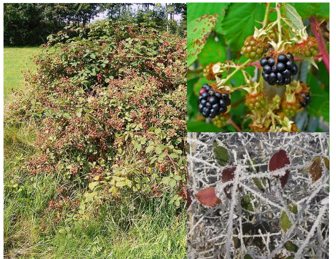
Ronce des bois ( Rubus fruticosus ) (E, H1-2)