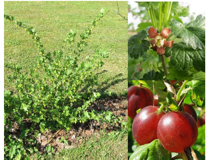
Groseiller épineux ( Ribes uva-crispa ) (E, H2)