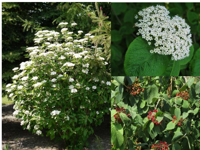
Viorne lantane ( Viburnum lantana ) (H4)