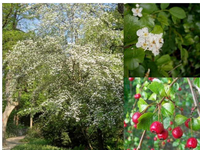
Aubépine à deux styles ( Crataegus laevigata ) (E, H4)