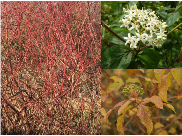
Cornouiller sanguin ( Cornus sanguinea ) (H5)