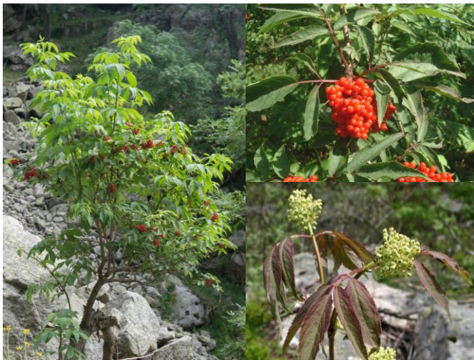
Sureau à grappes ( Sambucus racemosa ) (H4)