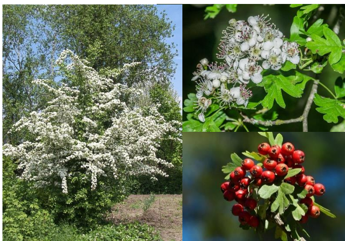
Aubépine monogyne ( Crataegus monogyna ) (E, H4-10)