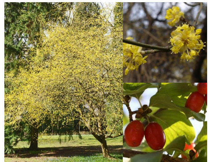
Cornouiller mâle ( Cornus mas ) (H5)