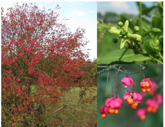
Fusain d'Europe ( Euonymus europaeus ) (H3)