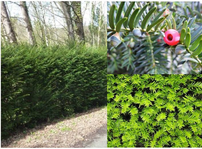
If ( Taxus baccata ) (H20, P)