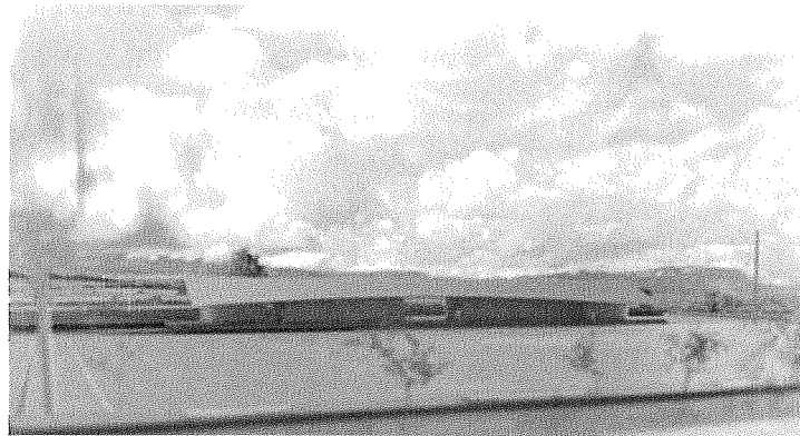
Image de synthèse du bâtiment vu depuis l'emplacement de l'actuelle bibliothèque

meubler sera placé aux alentours du nouveau bâtiment afin, notamment, de maintenir une distance raisonnable vis-à-vis des habitations.