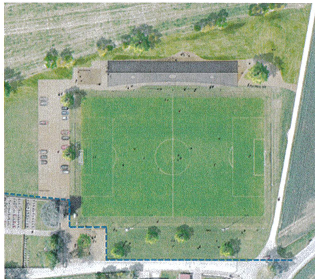
Image de synthèse des futures infrastructures sportives

Le projet prévoit la création d'un nouveau bâtiment à l'Ouest, de l'autre côté du terrain par rapport à l'emplacement actuel, l'insertion des locaux du club de pétanque « Les amis de la boule » dans ce même bâtiment, ainsi que la création de 45 places de parc au Sud, sur l'actuel terrain d'entraînement, le remplacement de l'éclairage et la mise en place d'un arrosage automatique. Les environs du terrain seront également aménagés de manière à devenir des lieux de détente accessibles à l'ensemble de la population en tout temps. Enfin, l'espace actuellement occupé par le bâtiment existant sera transformé en une zone de verdure arborisée.